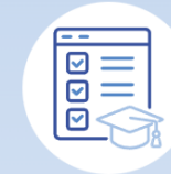
Category 3. Student's learning assessment