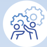
Category 4. Impact and mission with and for society

HORIZONTAL PRIORITIES IN ALL 4 CATEGORIES: