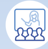
Category 2. Innovative teaching and learning