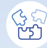
Inclusion and diversity