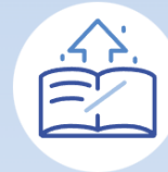
Category 1. Student-centred course design

FIND GOOD PRACTICES IN 4 AREAS AND 4 PRIORITIES